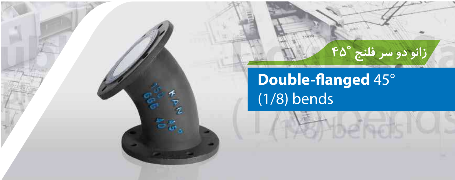
زانو دو سر فلنج ۴۵°