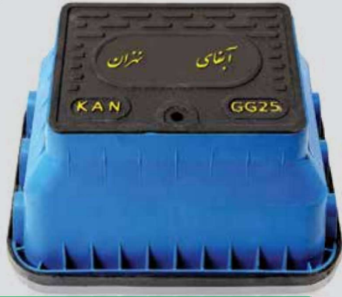
P.P - Water Meter Box